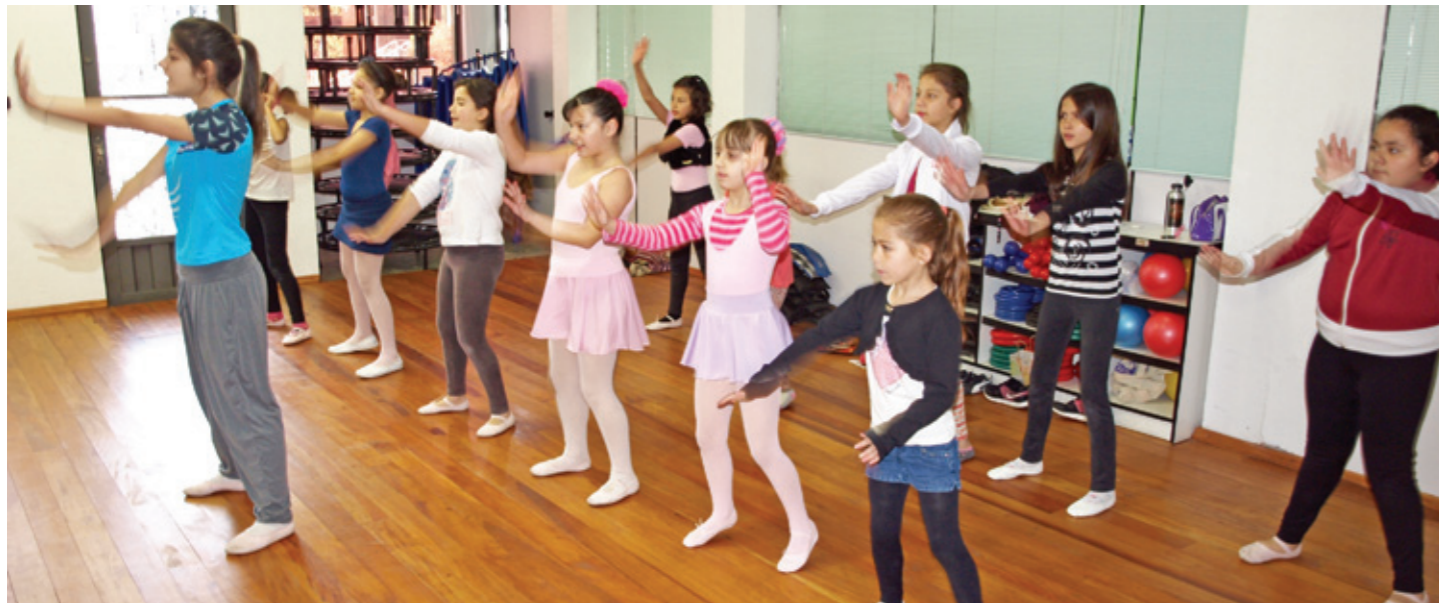
Professoras habilitadas acompanham as atividades das crianças

Está confirmada para o dia 13 de dezembro (sábado pela manhã), no auditório do Colégio São José, no Centro de Caxias do Sul, a apresentação das crianças participantes do projeto social Ritmos do Amanhã, que tem suporte financeiro do projeto Fuja do Estresse, Corra pra Saúde. O apoio atende ao que determina a legislação estadual que criou o Pró-Esporte, que exige ações de responsabilidade social dos projetos favorecidos pela renúncia fiscal do Estado. A apresentação no