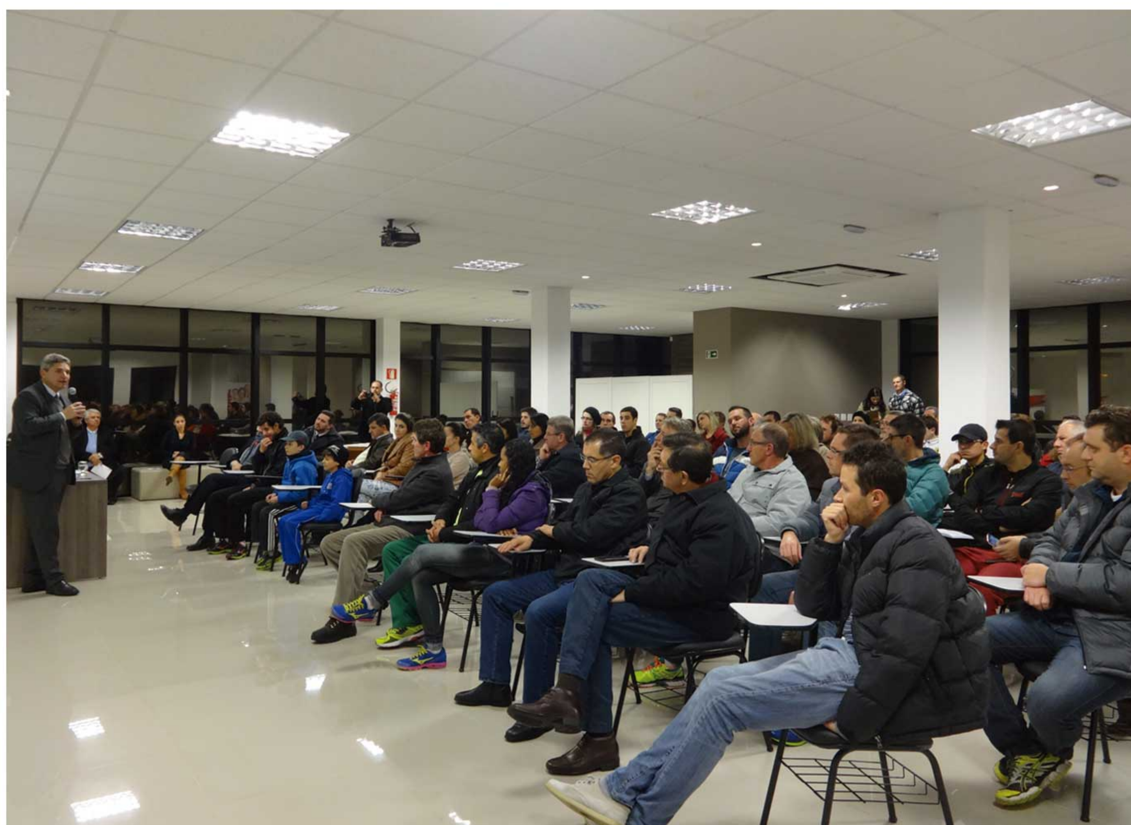
Assembleia de constituição do IFECS nas instalações da Microempa